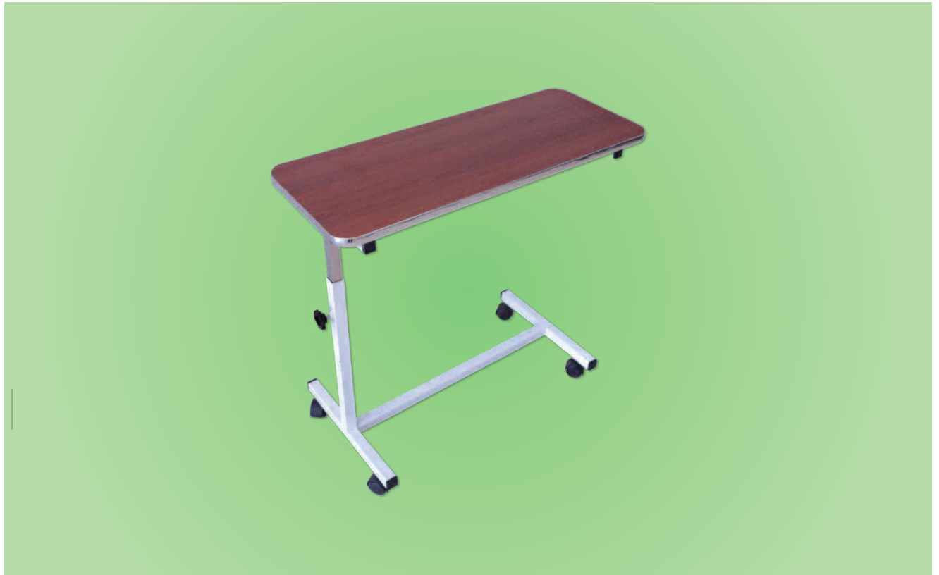
TABLE À MANGER AU LIT EN BOIS TMBE1