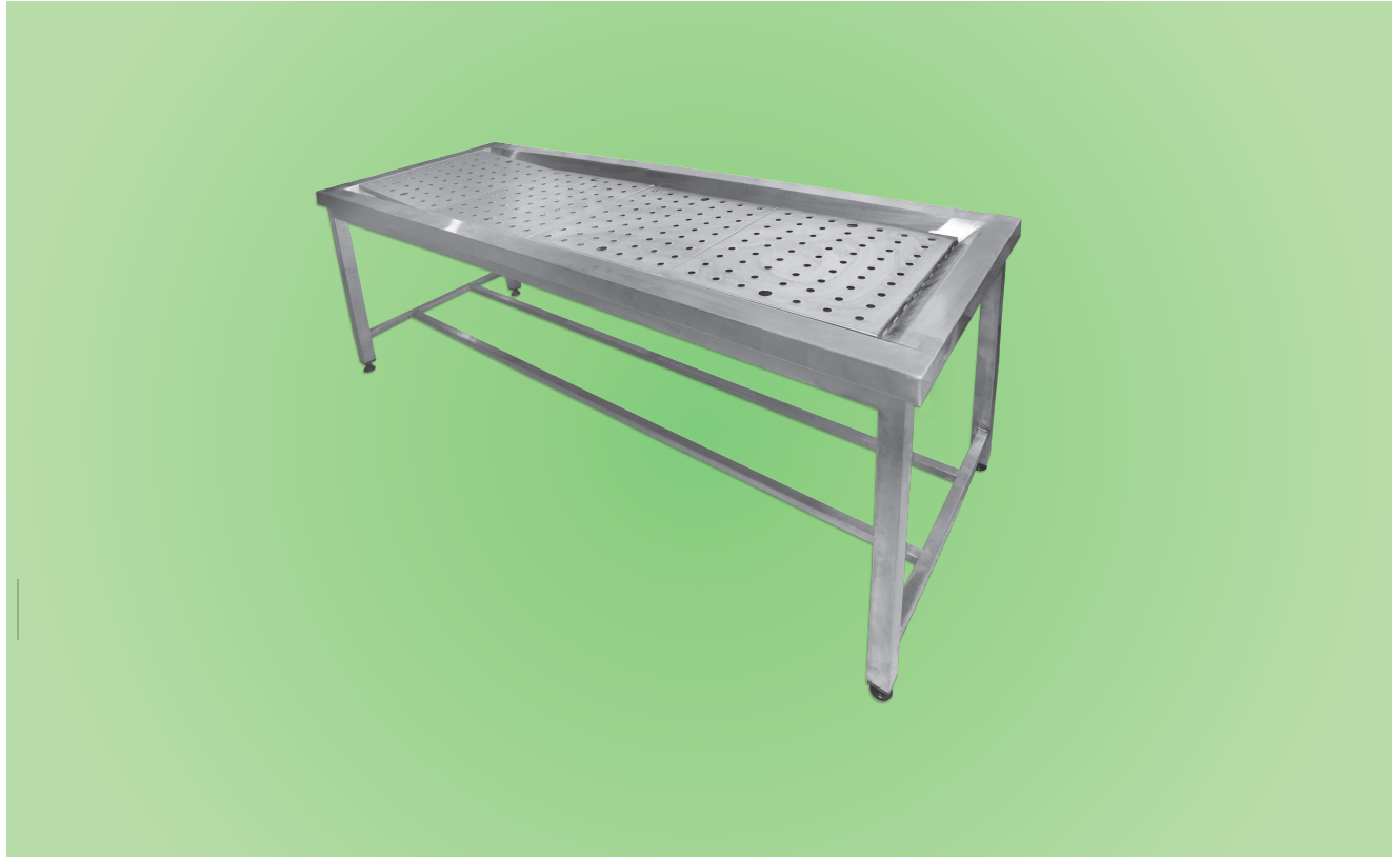
TABLE D'AUTOPSIE DE LAVAGE DE CORPS TLC01