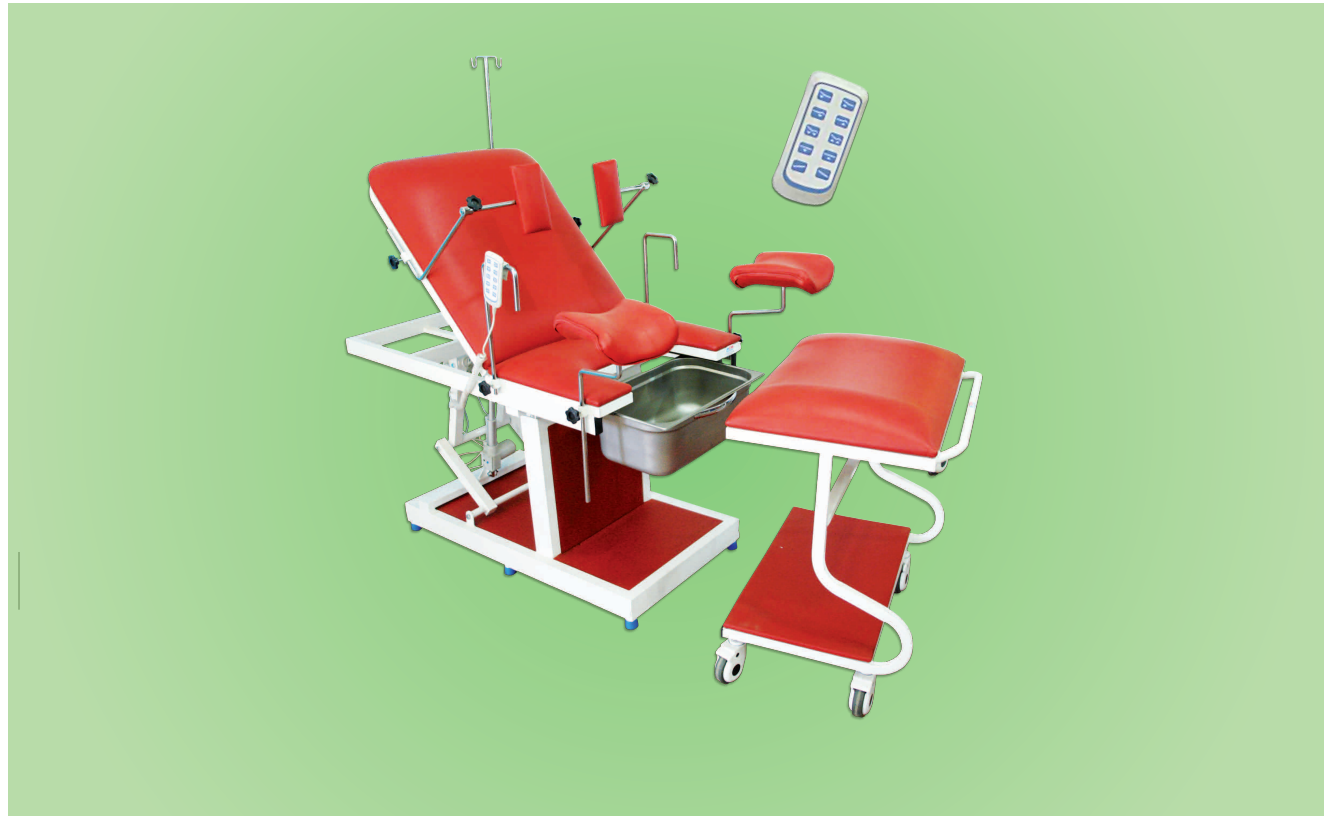
TABLE D'ACCOUCHEMENT ÉLECTRIQUE TBAE