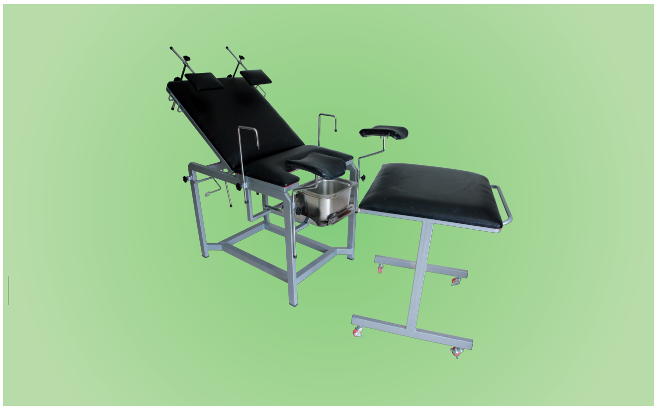
TABLE D'ACCOUCHEMENT TBA002