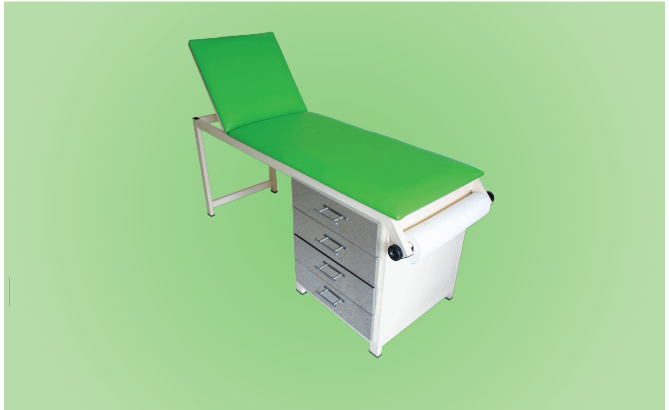
TABLE D'EXAMEN AVEC QUATRE TIROIRS TE4T