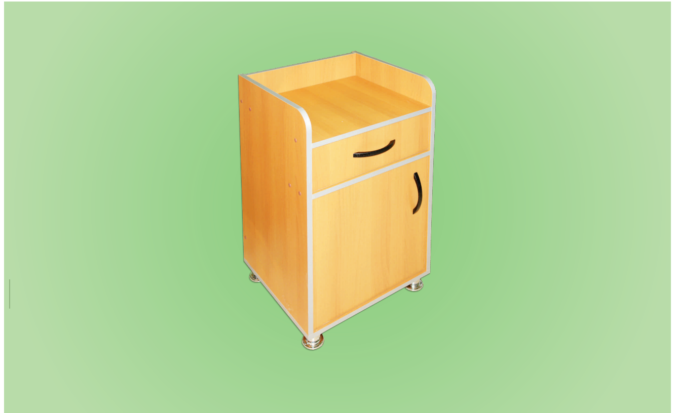
TABLE DE CHEVET TCBGM01