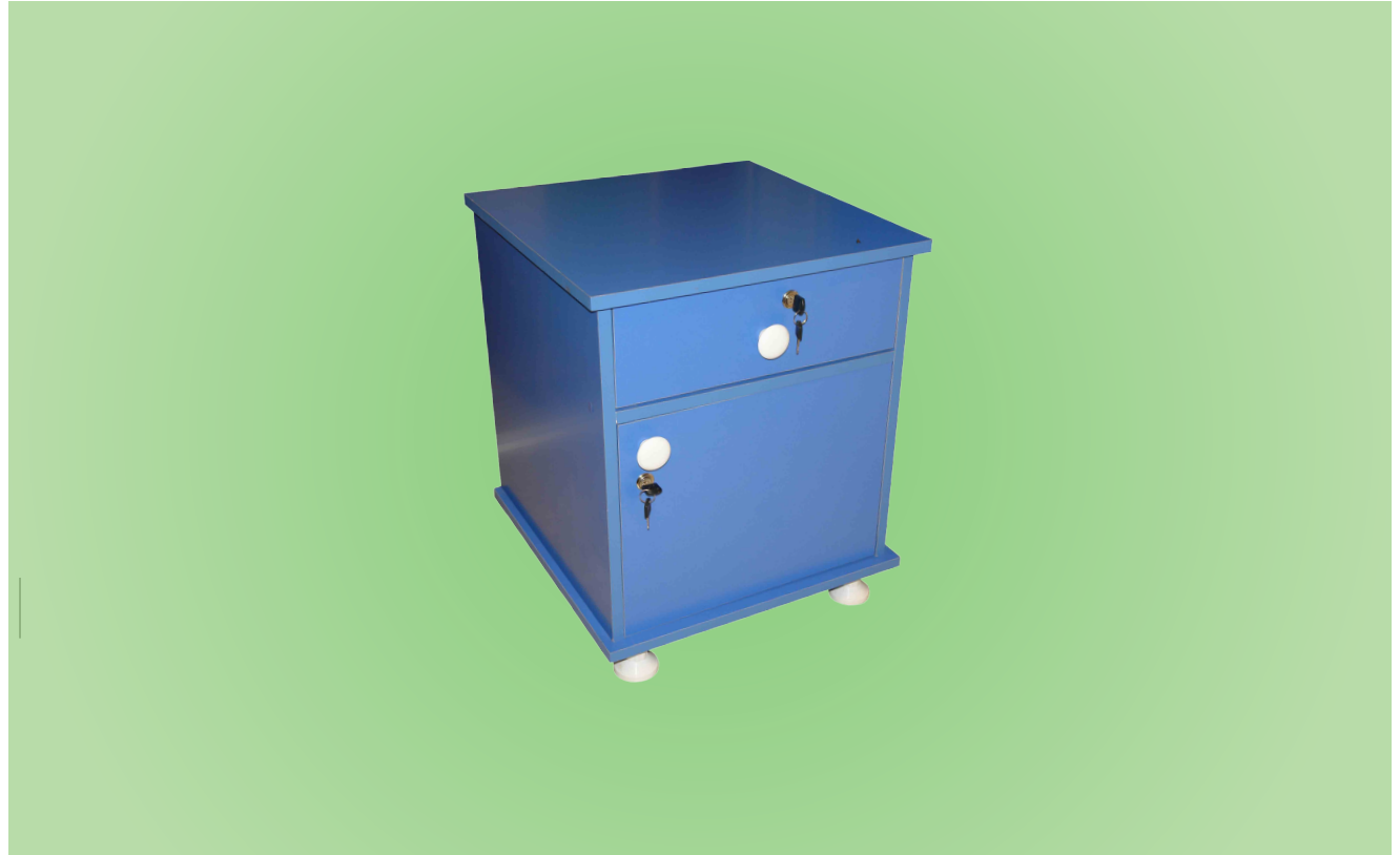
TABLE DE CHEVET À CLÉ TCBPM01