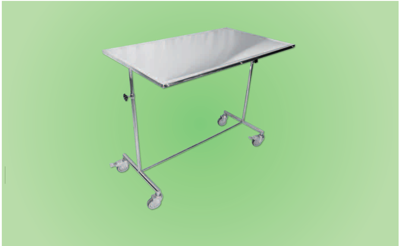
TABLE DE MAYO GM TM03