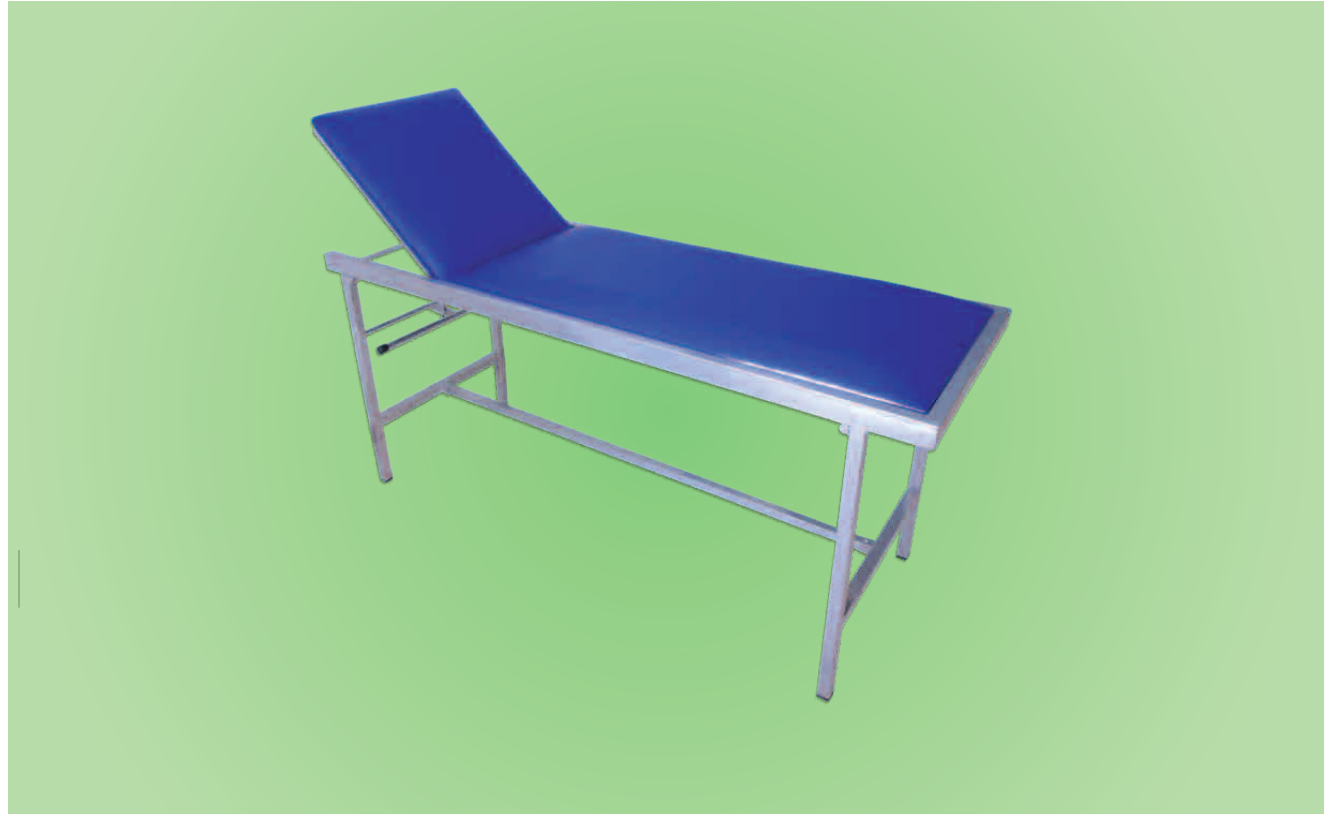
TABLE D'EXAMEN PLIABLE TEP001