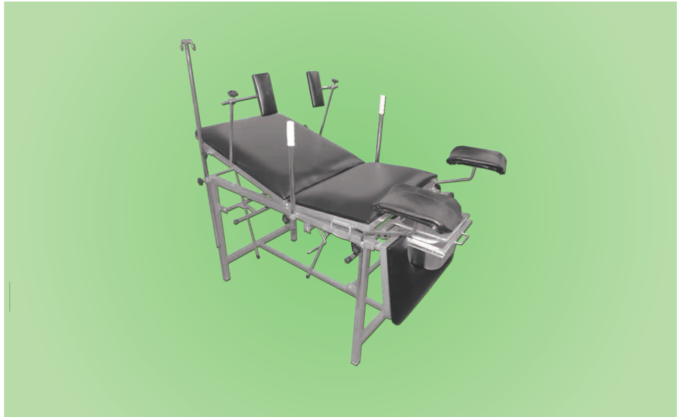
TABLE D'ACCOUCHEMENT TBA004